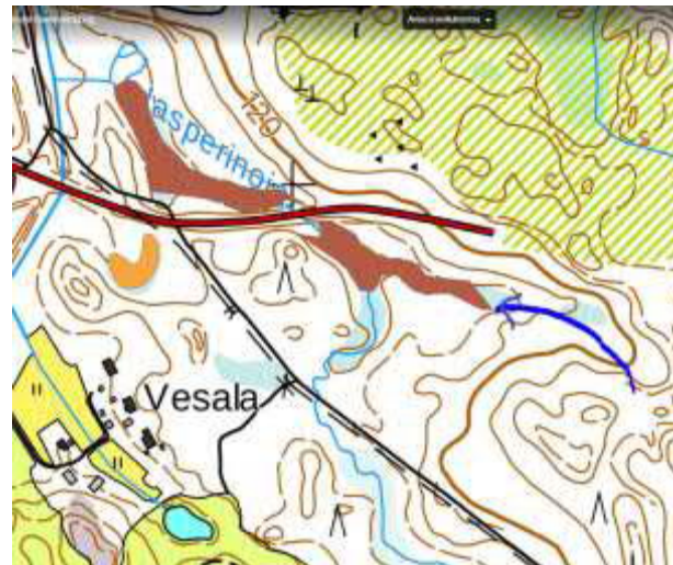
Kuva 2. Metsälaki- ja vesilakikohteet. Nuoli osoittaa noron.

Metsäkeskuksen tiedoissa alue on merkitty metsälain erityisen arvokkaaksi elinympäristöksi purokohteena (kuva 2ruskea alue).