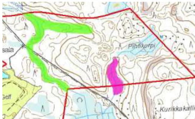
Kuva 5. Siton luontokartoituksesta

Kaavamateriaalin liitteenä oleva Siton luontokartoitus ottaa omalla, hieman erikoisella tavallaan kantaa noroihinmainitsemalla seuraavasti: Huomionarvoiset luontokohteet keskittyvät selvitysalueelle sijoittuvien luonnontilaisten tai niiden kaltaisten purojen läheisyyteen (Kuva 5). Lapin läänin ulkopuolelle sijoittuvat luonnontilaiset norot on suojeltu Vesilain 2. luvun 11 § mukaan. Vesilain mukaan uoman luonnontilaisuutta ei saa vaarantaa.