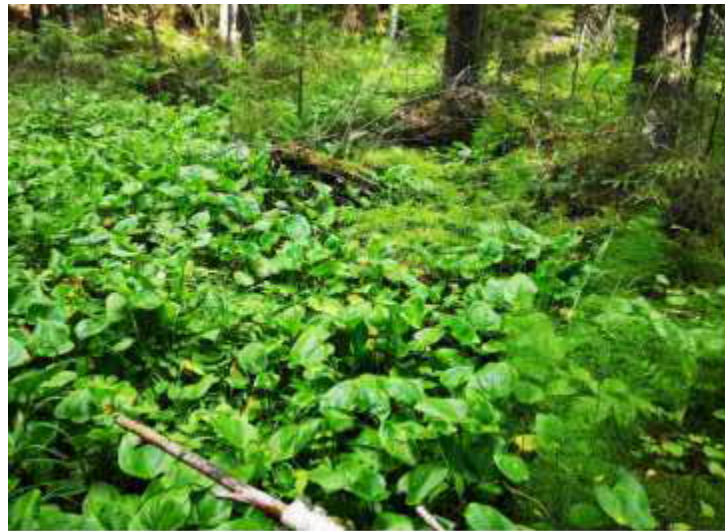
Kuva 4. SLL:n luontokartoituksesta

osoituksena kohteen luonnon monimuotoisuudesta. Kuvassa 4 on luhtavaikutteista ruohokorpea, joka sijaitsee kuvan 5 punaisella alueelta.